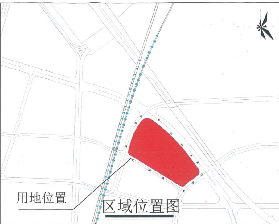
用地位置 区域位置图